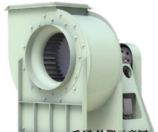
B81系列外觀示意圖 B81 SERIES IMAGE