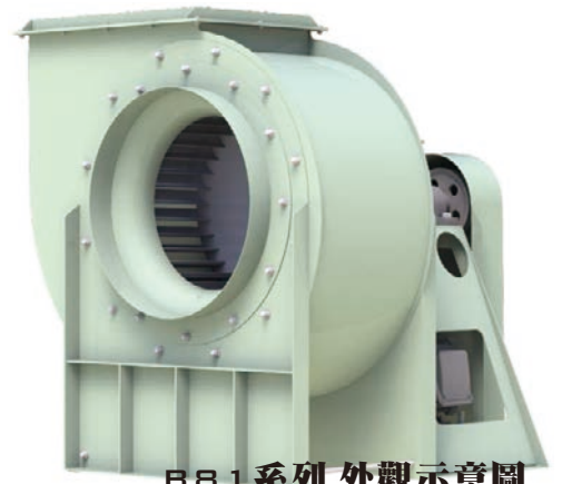
B81系列外觀示意圖 B81 SERIES IMAGE