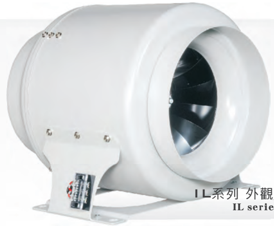
IL系列 外觀示意圖 IL series image