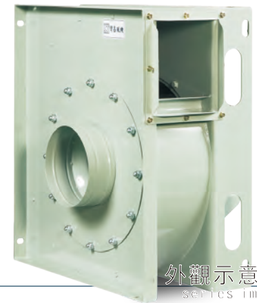
外觀示意圖 series image