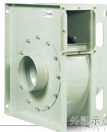
外觀示意圖 series image