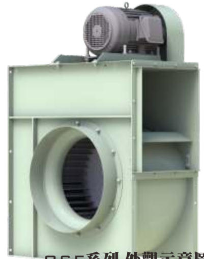
OSF系列外觀示意圖 OSF SERIES IMAGE